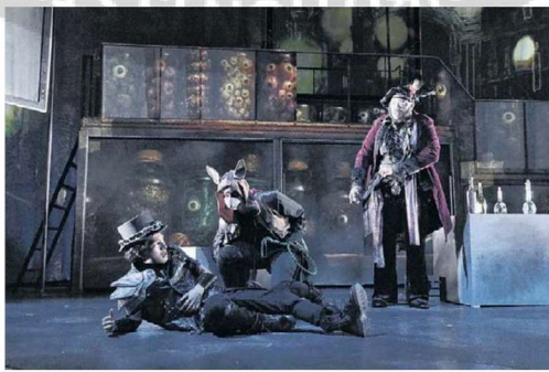
Un mundo de fantasía cobra vida propia en la pieza teatral.

Fidel concibió el escenario como una interfaz, un portal vivo hacia un entorno digital, en lugar de una escenografía tradicional, y nuestros diseñadores le están dando vida a esa visión en maneras maravillosas. Colaborar con este equipo es como caminar junto a gigantes, incluso con quienes sólo tienen 14 años", dice el dramaturgo Gabriel Rivas Gómez.