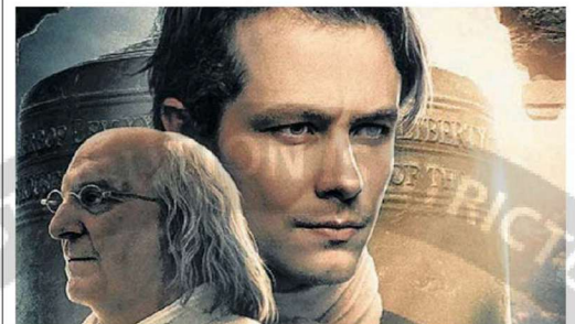
La producción narra la historia de Whitefield y Franklin.

Más información en: www.agreatawakening.com